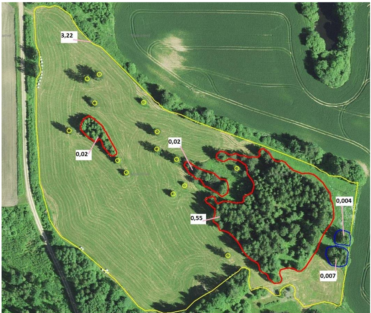
Joonis 1. Puudegrupid ja üksikud puud